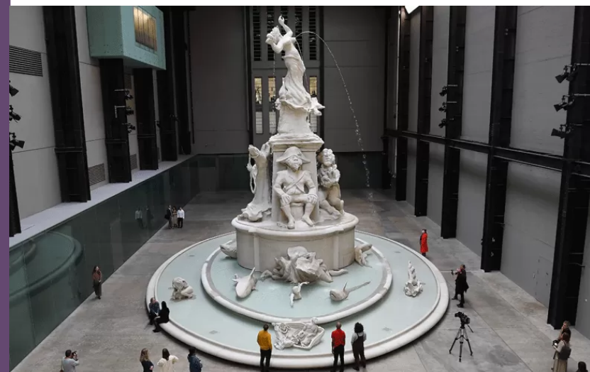
Imagen de la obra " FONS AMERICANUS " (2019) de Kara Walker