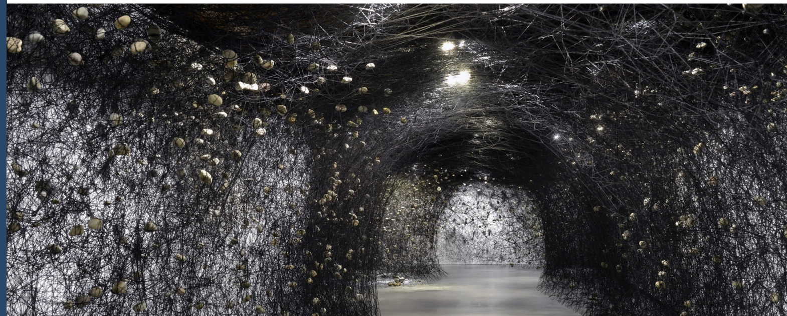
Imagen de "In the beginning was..." (2015) de Chiharu Shiota